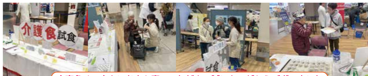
大変多くの方々にお立ち寄りいただき、誠にありがとうございました