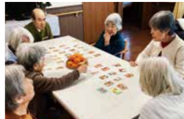
カードゲームも真剣に取り組んでいます

リフシアでは、神明・香川・善行・矢畑・大庭の5事業所でグループホーム（認知症共同生活介護）を展開しています。グループホームでの1日の流れを紹介します。