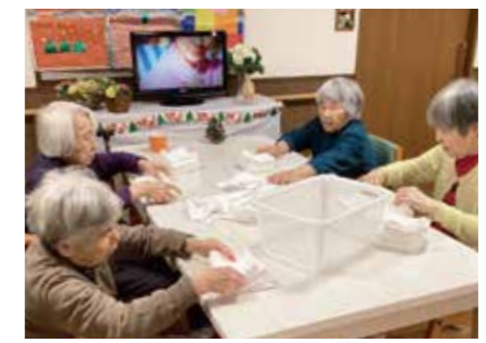
タオルたたみも生活リハビリ

リフシアのグループホームには認知症のお客様がご入居されています。ユニットと呼ばれる複数の居室と、台所や食堂などで構成された生活空間で、コミュニケーションを通してお客様にも家事などの役割を担っていただき、自立した生活を目標すことを目的としながら共同生活を送っていただいております。リフシアでは、科学的介護の「根拠に基づく介護」の視点から自立支援や重度化防止に取り組んでいます。ご利用前のご家族からは、「入院してから車椅子生活になって、歩けなくなったり」「自分で出来る事が少なく、ぼーっとしていることが増えた」という声が多く聞かれます。しかしながら、グループホームで生活を送るようになり、個別機能訓練や家事などの生活型リハビリを通して「歩いて散歩にいけるようになった」「一緒に外出ができた」「要介護度がさがった」などの嬉しい変化も数多く聞かせていただいております。職員全員が、お客様お一人おひとりの課題を共有して日々の生活を送る中で、自立支援介護につながる支援を提供し課題解決を目指していく。そんなリフシアのグループホームの一日を紹介させていただきます。