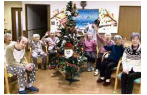
クリスマス会を記念してみんなで一枚