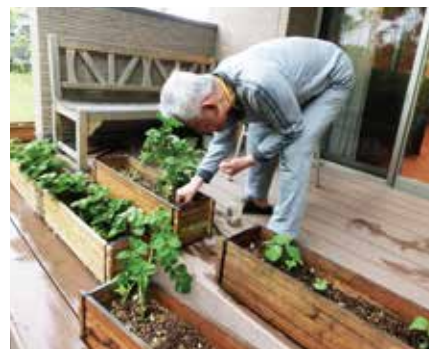
家庭菜園は実りの時期まで楽しみが続きます。

り、安否確認などの見守りサービスも完備しております。近くにスーパー、目の前にコンビニと、お買い物やお散歩にとっても便利な環境の中、地域社会との触れ合いを維持しながら快適に生活していただけます。 サ高住の特徴として60歳以上の方であれば、介護状態に関係なくどなたでもご入居いただくことが可能です。多くのお部屋はお一人様向けの作りになっておりますが、中にはお二人でお住まいいただける広さのお部屋もあります。 施設では毎週火曜日には健康体操を行い、皆様元気よく身体を動かされています。 また月に一度イベントを開