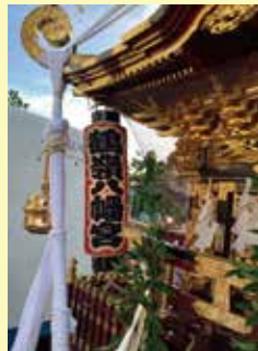
鶴嶺神社のお神輿

リフシア浜之郷の一員であることを誇りに、次は20周年に向けて多くの笑顔を支えていけることに喜びを感じています。