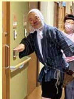
←職員による名演のドジョウすくい。

まだ暑さの残る9月15日(日)午後。この日のために特注した幕の内弁当を皆さまに召し上がっていただき、喜びの声が聞かれるなか10周年イベントがスタート。スタッフが一丸となり準備したさまざまなプログラムに加え、この日は民生委員さんが駆けつけて下さり、お祝いのお言葉と、敬老の記念品をいただきました。さらに例大祭を開催していた鶴嶺神社のお神輿も立ち寄っていただき最高の盛り上がりと共に、沢山のお客様の笑顔を見ることができました。