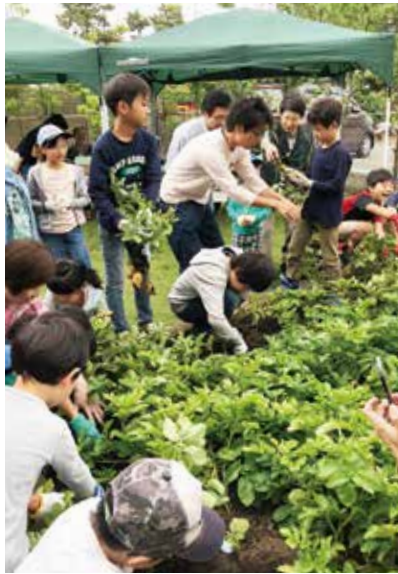
近隣の子供たちと楽しく交流会。立派なお芋がたくさん収穫できました。