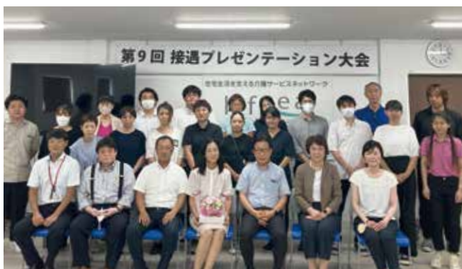
各事業所の委員は、通常業務に加えて、試行錯誤しながら活動を展開しました。上手くいく時もあれば、壁に当たることもありながら1年間やり遂げました。委員の方々1年間お疲れ様でした。

8月28日リフシア研修センターにて第9回接遇プレゼンテーション大会を開催いたしました。今回はQC(Quality Control:品質管理)活動とサービスタウン統轄部による事業所ラウンドの実践から「全職員にリフシア理念に沿った接遇5原則の底上げ」「接遇5原則チェック・他者評価の向上」を目指し、各事業所の接遇委員を中心に様々な活動に取り組みました。本大会では、その実践を事業所ごとに発表し、互