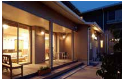
夏は夕涼み、秋は虫の声を聞きながらテラスでのんびりゆったりした時間を過ごせます。

お客様の中には、「住み慣れた地域で、出来ることは自分で行い、自立した生活を継続したい」とご入居される方が多くいらっしゃいます。また、お客様からは「家では一人だけですが、ここは友達や気の合う仲間もいて楽しいです」「自宅にいと外に出なかつたけど、今は皆さんとの交流があり社会性があります」「程よい距離感で見守っていただける安心感があります」「自由に会いに行けて外出できるのがとても良いです」「ヘルパー事業所も併設されていて心強いです」などのお声をいただいております。お客様にもご