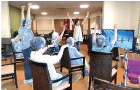
毎週火曜日はみんなで元気に身体を動かして体力づくり。

リフシア浜之郷では、自立した日常生活を支える訪問介護や24時間対応型の定期巡回随時対応型訪問介護看護の他に、サービス付き高齢者向け住宅（サ高住）の事業を行っています。 茅ヶ崎の鶴嶺八幡宮に面した緑豊かな住宅地に位置するこの施設は、全居室がバリアフリーになってお