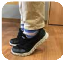
親指に体重をかけます