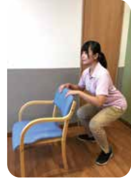
そのまま腰を落とします