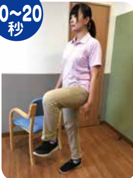
上半身はまっすぐ