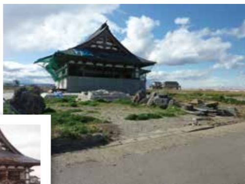
今はきれいに片づけられている東禅寺の本堂。左の写真は震災直後の状況。

住宅『あがらいん』というケア付き制度外仮設住宅のことを教えてもらいました。認知症や障がい者向けの住宅にレストランやボランティアの宿泊スペースがあり、日常的に住民や仮設住宅の支援員、ボランティアが交流しているそうです。キッチンカーで総菜などの移動販売も行っていて、新しいコミュニティになっているという事でした。