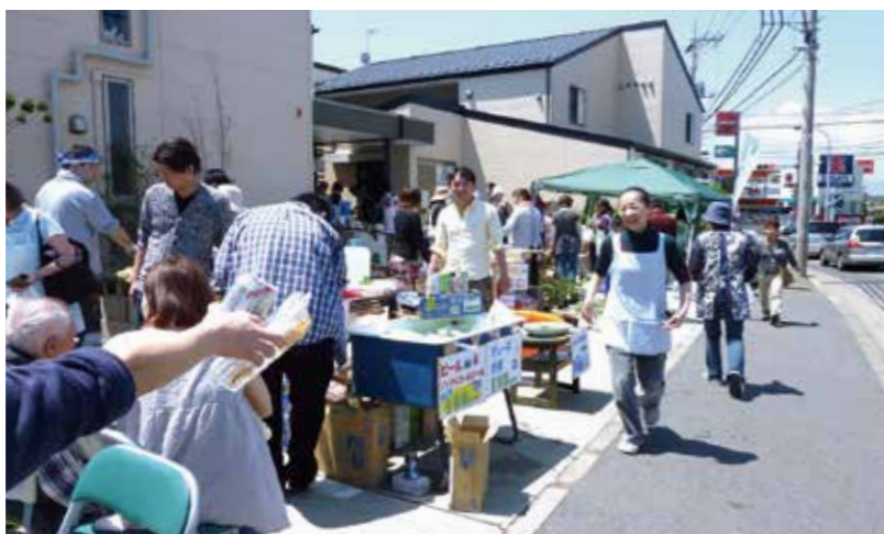
一日人足が絶えないバザー会場(らいい神明駐車場)

平成25年4月28日(日)、リフシアで取り組む6回目となる震災復興バザーが、「らいい神明」(藤沢市)で行われました。当日は快晴にめぐまれ、オープン前から地域の皆さまが沢山詰めかけてくださいました。バザー品販売のほか、「らいい神明」スタッフ手作りのシユウマイ、焼きそば、フランクフルト、よもぎ団子、唐揚げ、駄菓子屋等と、ヨーヨー釣りや東北物産展が並びました。テラスにはご家族が