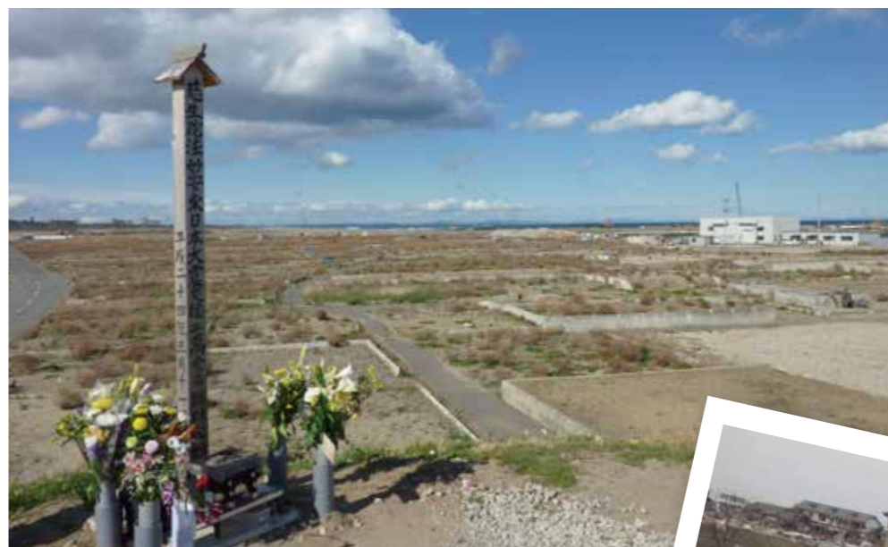
日和山から見える景色。以前は民家が並んでいました。山と言っても6m程度の高さですが、閉上の人たちのシンボルでした。山頂にあったお社も津波に流されたそうで、今は亡くなった方のご冥福を祈る卒塔婆が行んでいます。