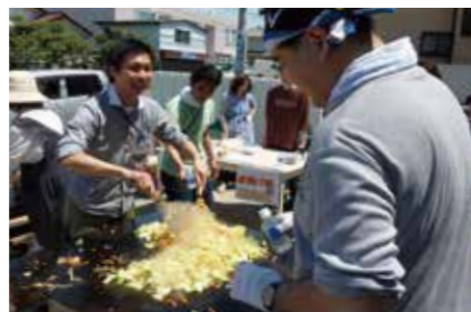
お天気が良かったので、大汗をかきながら特製鉄板で焼きそばを作る、「らいい神明」の熊本所長(写真左)とスタッフ