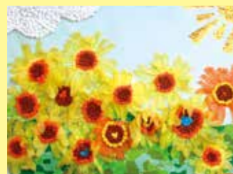
らいふ秋園の皆さんの作品

百花繚乱といわれるほど色々な花がありますが、今号から、咲く季節に合わせて、色々な花を紹介しします。第一回は夏の花・ひまわりです。