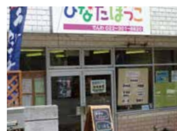
地域の材料で作るランチメニュー