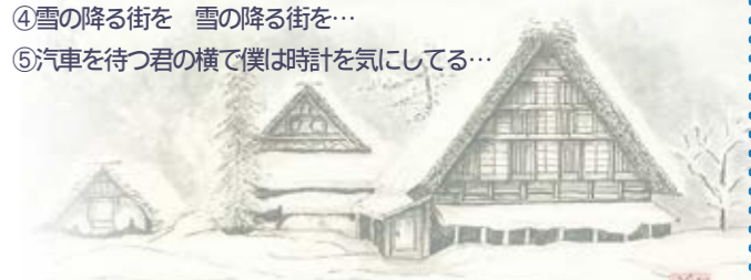
今回は歌謡曲も入れてみました。こうしてみると、冬の歌は意外に多彩な歌が多いのに気がつきます。(井)

答え⑤イルカ「なごり雪」④高英男「雪の降る街を」③童謡「ベチカ」②都 はるみ「北の宿から」 イラストレーション加藤 芳明さん