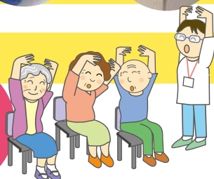
元気呼ぼうリハビリ体操