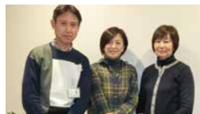
ケアプランリフシア浜之郷

介護保険の手続きやサービスの種類、利用方法、サービス付き高齢向け住宅の住まい方や費用の事など、ケアマネジャーの私たちがご説明します。