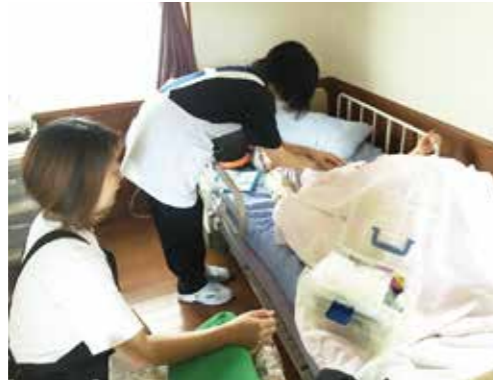
けが人を想定して応急手当の訓練(リフシア柳島)