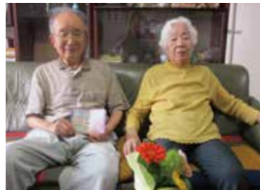
「自宅に戻ったらご主人と手をつなぎ、娘さんの手料理を食べる」、そんな豊かな生活が長く続きますように!

模多機能というサービスを知りました。色々見学をしましたが、できてまもなく、スタッフの方も明るく、こちらにお願いしようと思えました。もともと明るく、楽しい母でしたので、歌ったり踊ったり、楽しく過ごさせて頂いたと思います。 初めの頃は、まだ暴力行為も激しかったのですが、上手に受け止めて