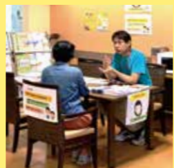
ケアマネジャー相談ブース、転倒予防、体力テストブースもありました

当日は天気も良く暑い中、沢山の方がきてくださいました。会場がリフシア浜之郷という事で、地域の皆様に「リフシア」の存在、「リフシア浜之郷」ってこういう所、またご入居されているお客様がいらっしゃるという事も外部のお客様に知って頂いたイベントになったと思います。