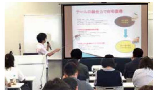
他の事業所の発表から熱心に学ぶスタッフ

リフシアには、デイサービスやシヨートステイ、地域密着型サービス(定期巡回随時対応型訪問介護看護、看護小規模・小規模多機能サービス、グループホーム)など在宅生活を支える様々な介護サービスがあります。現在400人近いスタッフが活躍し、日々お客様へ先進的なサービス提供を行っています。どのような取り組みをしているか、今回初めて事例を募集しスタッフの前で発表する機会を作りました。誌面の関係で、発表のテーマだけ紹介し、スタッフの目指す介護の想いが伝わる感動する内容でした。第2回も開催したいと考えています。