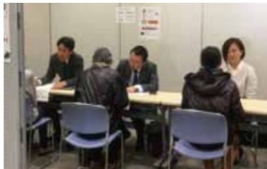
丁寧に対応してもらえると好評だった相談コーナー↓

昨年12月、20名のリフシアフェスタ実行委員が集まり、プログラム内容などを話し合いました。若手が中心の企画会議は去年よりパワーアップ3月25日に向けプロジェクトが始動しています。