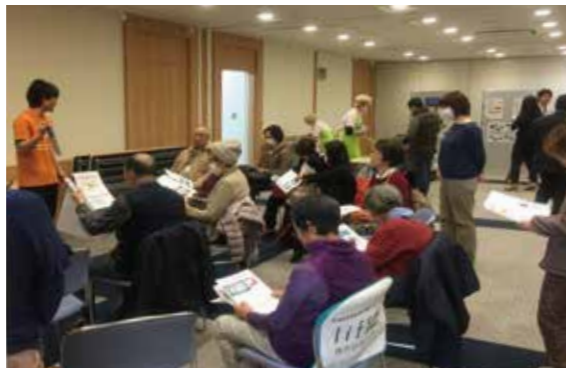
健康呼ぼう講座は終日満員御礼でした。講座の合間におもちゃの体験コーナーがあり、自然と盛り上がり会話も弾みました。